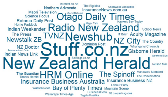
Whakaahua 1: Puna tuhinga, ngā tuhinga waiwai

I iheua atu ngā hōkaitanga pāho kia puta ko ngā wāhanga e whā i huangia ake i te urupare a te Kāwanatanga i te whatinga mai o te Kōwhiri-19 i te marama o Poutūterangi 2020. Ka whakamahia hoki te wātaka o ngā pārongo nui i whakaputaina e te Manatū Hauora.